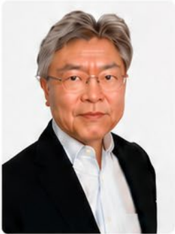
Enspirea LLC Founder & CEO